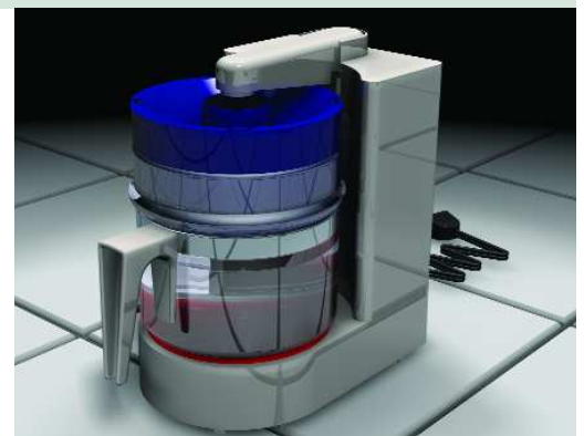
Des scènes réalistes simulent l'environnement réel du produit.

Pour compléter la scène, vous pouvez ajouter des options d'environnement intérieur, extérieur, de lumière ambiante, naturelle, de spots. Les spots et lumières ponctuelles peuvent être placées n'importe où dans la scène en contrôlant leur intensité et luminescence. Le focus et le cône d'illumination s'ajustent également.